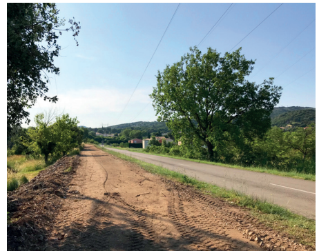
Travaux des modes doux