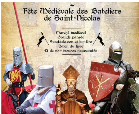
Fête Médiévale 2023