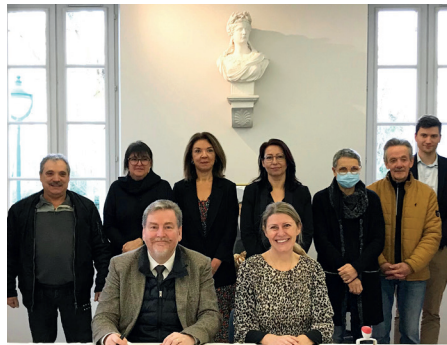
Convention de rappel à l'ordre