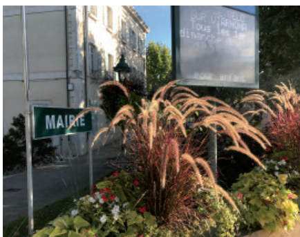
Le conseil municipal