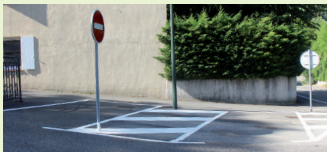
La nouvelle matérialisation des places de stationnement, rue de la Combe, permet désormais un accès facilité au parking.