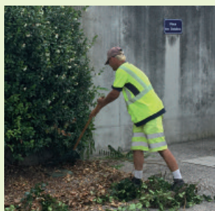
Nettoyage des escaliers et taille des haies réalisés par les équipes des services techniques.