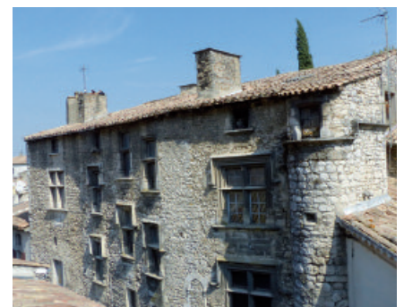
La Maison d'Arlandes